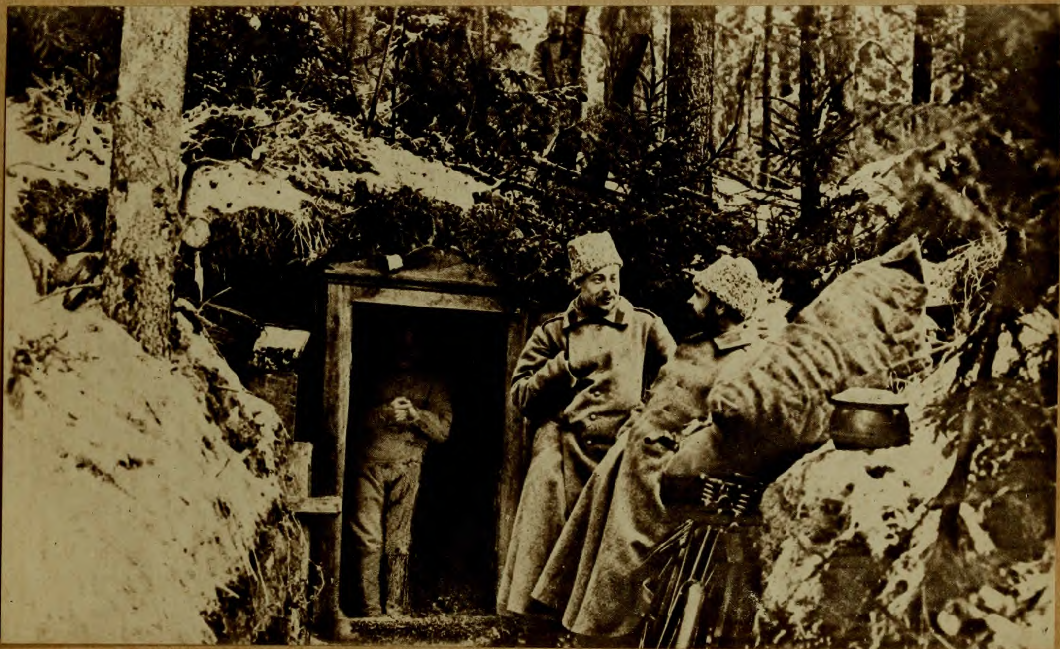
Въ землянкѣ — (убѣжище для офицеровъ).